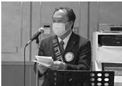
ニコニコBOX 寺本会員