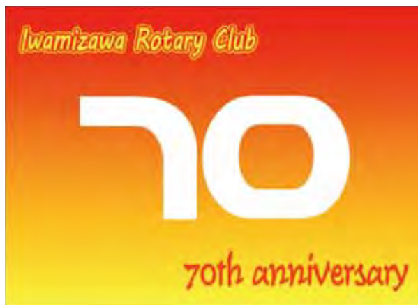
今年度 岩見沢ロータリークラブは創立70周年を迎えます

第3358回例会プログラム 令和6年3月28日 会報・公共イメージ委員会担当例会