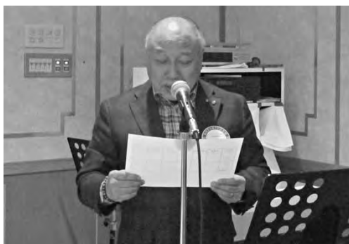
出席報告 小池出席委員長