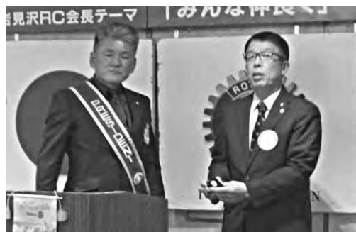
ポールハリスフェローバッチの授受 大作会員