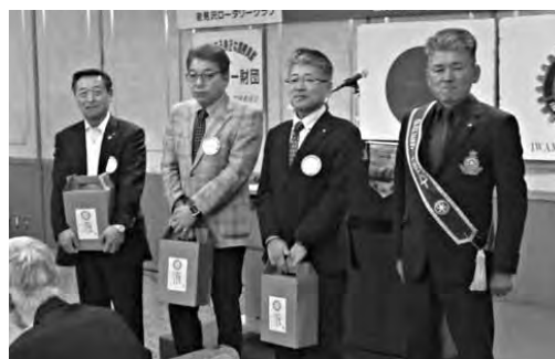
会員5月の誕生祝い