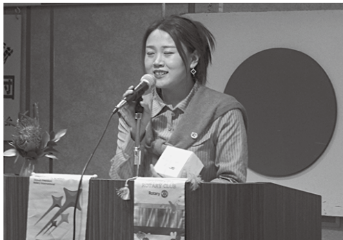
田影さん学位授与の記念品授与