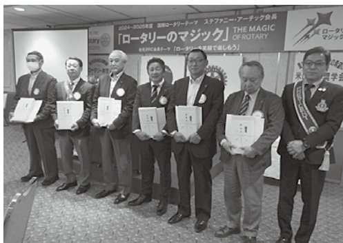
10月誕生日の皆さん