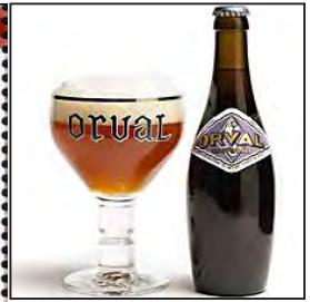
orval ビールと専用グラス