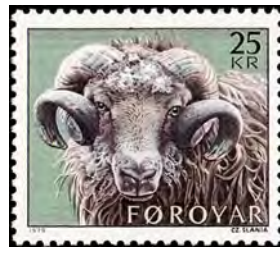
フェロー島、モナコ発行の スラニア凹版切手

2 番目は万国郵便連合のサイトです。約 200 の地域と国の 2002 年から 2013 年に発行された切手が登録されています。国によっては完全にすべてを登録されていませんが、その登録されている切手の画質は 200 ~ 600dpi の高画質で