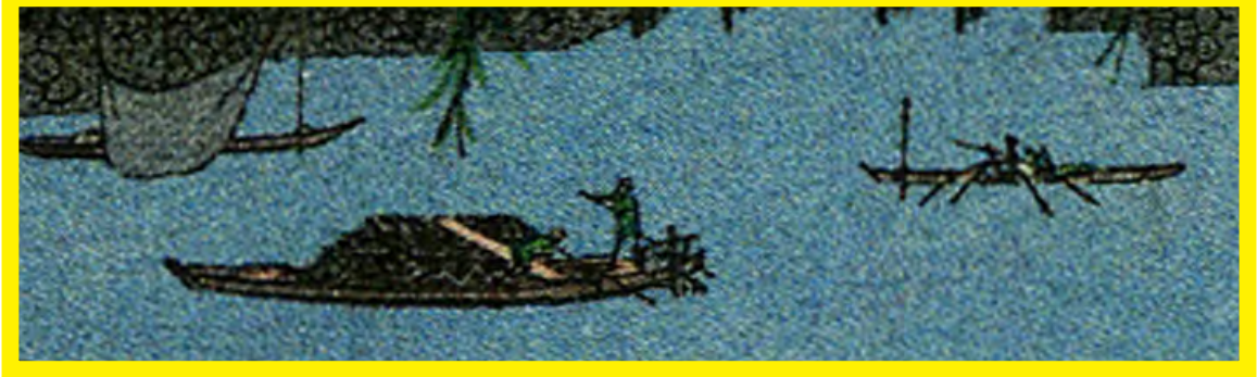
ダウンロード 600dpi 鐘か淵切手画像をズームインすると江戸の漁法が偲ばれる

は日本切手カタログでシートで扱われてなにが描かれているか判らないものも、さすが 600dpi 画像、詳細な画像が見られます。例えば、上の浮世絵切手をクリックしダウンロードした FILE を拡大すれば櫓と棹で舟をあやつる人、四つ手網を上げてる舟、四つ手網を沈めている舟がはっきり見えます。