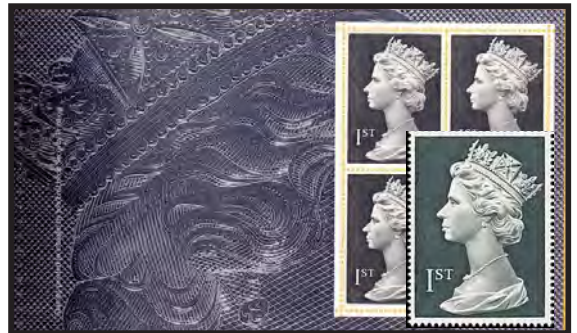
スラニア彫刻原版の拡大図とその高額切手