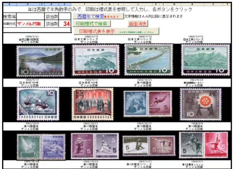
図5 特定検索 sheet 画面 (「ザンメル凹版」印刷方式での検索)