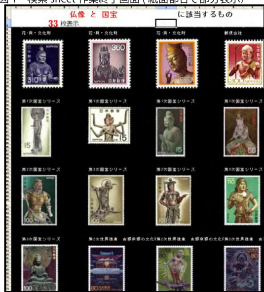
図2 検索画像 sheet 画面(紙面都合で部分表示)

きないものになってしまいました。最近の切手の種類の多さの馬鹿さ加減を考えると、近いうちにDVDでも記録できなく、2層DVDが必要になることは必然かと危惧しております。