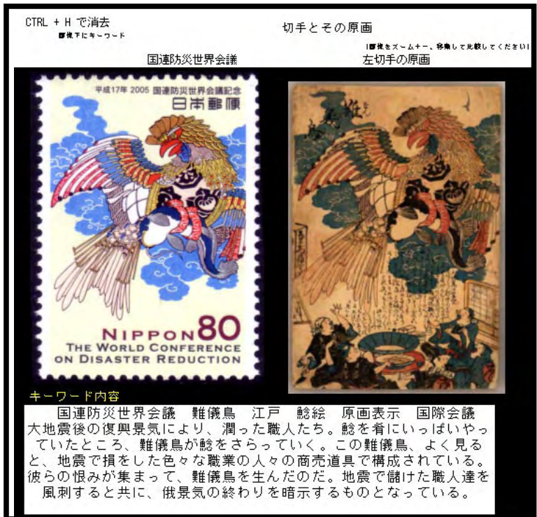
図6 原画写真 sheet 画面 (2行目以降の文章は Keyword でなく、備考欄記録内容)

また、江戸400年シリーズの江戸名所図屏風。これも郵便会社のHPの発行案内では「1629～30年頃の江戸の様子を描いた八曲一双の屏風です。本切手は、歌舞伎小屋の様子を描いた部分です。(出光美術館蔵)とだけです。この原画を調べると図7のように'部分'と表示してありますが、極小部分であることと、町人文化栄える江戸の400年