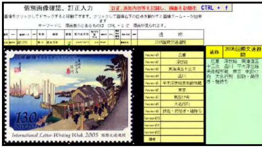
図3 補足修正 sheet 画面

です。虫か昆虫か、浮世絵か版画浮世絵か、こんなことは、しっかり入力メモ書きを作成しておけば混乱することはないのですが、これができるません。更に、個人の嗜好で KeyWord に偏りが生じてしまっていることは否めません。文化財関係には所蔵機関名まで入力するのに、天然記念物には生息地すら入力してません。このあたりが個人的に製作していることの弊害で、会員諸兄姉の助けが欲しいところです。