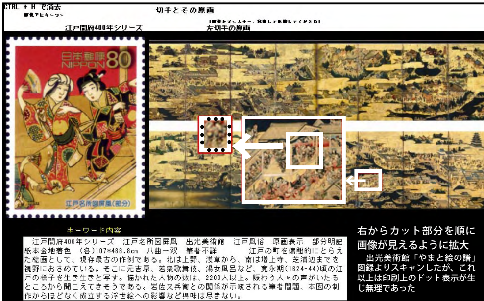
図7 原画写真 sheet 画面 (稲門フィラテリー 32号切手偏見の問いかけへのお答えです)

を切手に表現しようとした意図がよくわかる、江戸の賑わいを知ることのできる、実に大きな屏風(原画?)です。