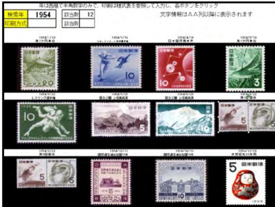
図4 特定検索 sheet 画面 (「1954」年での検索画像画面)

です。虫か昆虫か、浮世絵か版画浮世絵か、こんなことは、しっかり入力メモ書きを作成しておけば混乱することはないのですが、これができるません。更に、個人の嗜好で KeyWord に偏りが生じてしまっていることは否めません。文化財関係には所蔵機関名まで入力するのに、天然記念物には生息地すら入力してません。このあたりが個人的に製作していることの弊害で、会員諸兄姉の助けが欲しいところです。