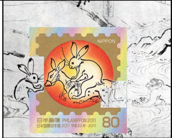
オフセット・金箔・アルミ箔・エンボス加工の日本国際切手展 2011 の 500 円切手と 豆兔蒔絵螺鈿硯箱 東京国立博物館蔵