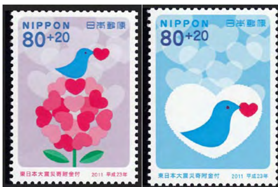
東日本大震災切手5種のうちの2種

発行以外に、最後のふるさと花切手（静岡、愛媛）の2種が他のふるさと花切手と同じく200万シート発行され、他の切手より600万枚多く1000万枚発行されていることによる。また、同じシート内で枚数が極端に異なる種類で発行されることによる発行枚数の多さということが明らかに目立ってきた