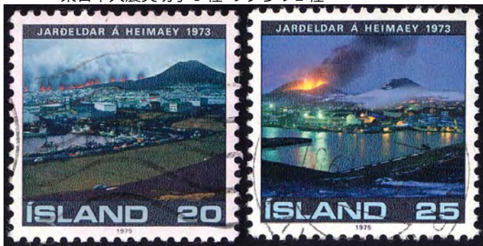
市街に迫る火山爆発 1975年アイスランド発行切手