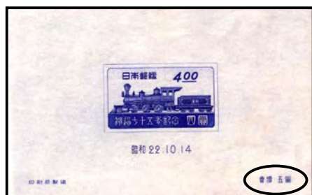
4 円額面鉄道 75 年弁慶号切手小型シート (1947 年) 賣價五圓が印刷されている。

今年、特記されることは、1979 年から 35 年間 220 種類の切手が発行されてきたふみの