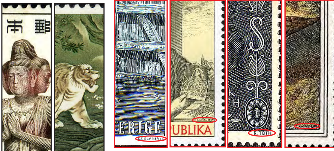
サンメル凹版 国宝シリーズ 階調凹版 政府印刷 100年 彫刻者 SLANIA スウェーデン HOUSA チェコ 彫刻者 TOTH オーストリア GANDON フランス

清水寺、グラビアが?と思われたが、空を見ると松本城と異なり一つの差が判るが、他は難しい。