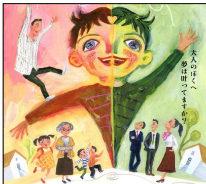
わたしとわたし、ぼくとぼく

よろず劇場とんがらし 幼児～低学年親子向き人形劇 3月7日(日) 那加福祉センター 迷子になった小坊主さんが見つけたのは山姥の住む家。お札を持たない小坊主さんの運命は？ドキドキワクワクのストーリー。