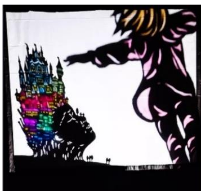
Shadow Kingdom ～影の王国

パントマイムユニットTORIO 幼児～低学年親子向き芸能 5月16日(日) 蘇原コミセン KOYOさんの七変化！観客を巻き込んだ大道芸は家族で楽しめます。