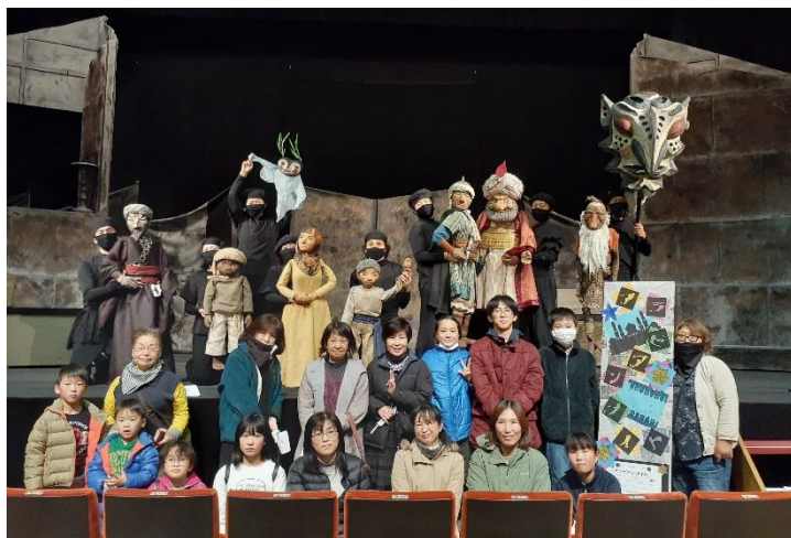
劇団さんと記念撮影♪