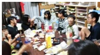
子ども実行委員会では子どもの 「やりたい」を形にします