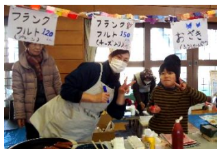
毎年恒例♪劇場まつり！