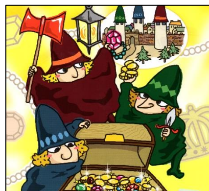
すてきな三にんぐみ

人形劇団望ノ社 高学年～大人向き影絵劇 10月17日(日) 市内体育館 観客の前で全ての影絵を操作するライブ感がたまらない！カナダ人と日本人の劇団。国内外受賞歴多数。