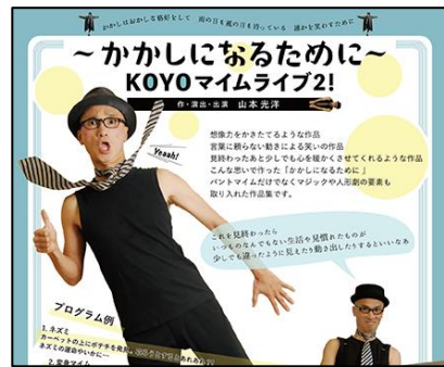
KOYO マイムライブ2! ～かかしになるために～

劇団うりんこ 高学年～大人向き舞台劇 3月21日(日) 中央小体育館 同性愛や性同一性障害などセクシャルマイノリティーをテーマにした児童劇。