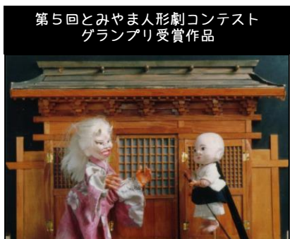
さんまいのおふだ

よろず劇場とんがらし 幼児～低学年親子向き人形劇 3月7日(日) 那加福祉センター 迷子になった小坊主さんが見つけたのは山姥の住む家。お札を持たない小坊主さんの運命は？ドキドキワクワクのストーリー。