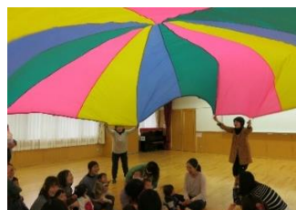
未就園児親子の活動♪

「生の舞台鑑賞」と「あそび(体験活動)」を通して、 子ども達が心豊かに育ってほしいと願い、活動しています。