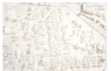
*浪江[福島県双葉郡]