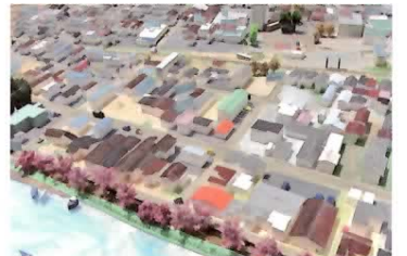
南気仙沼駅周辺[宮城県気仙沼市]

『大学生からみた復興支援活動』 同展展示の模型を中心となって製作した神戸大学をはじめ、地元横浜市立大学の学生など、実際に被災地に足を運んだ学生たちが見た「東北の景色」「復興」について率直に伝えるトークセッション。