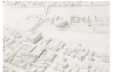
*石巻[宮城県石巻市]