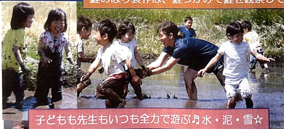
子どもも先生もいつも全力で遊ぶ♪水・泥・雪☆