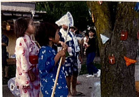
年長さんの屋台 折紙の虫とり